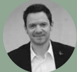
Pierre Etienne JAMES Architecte - Topoïein Studio

« Le projet de la résidence à Quetigny s'organise autour d'un patio, laissant les espaces paysagers s'insérer en douceur au cœur des bâtiments. Il profite d'une terrasse accessible au dernier étage dessinant une vue panoramique entre le parc urbain et le cœur de ville. Le projet noue un dialogue avec le végétal aussi par ses façades en camaïeu de verts pâles à soutenus. Les attiques sont ornés de pâtes de verre déclinant le motif vif et ondoyant d'un champ de coquelicots tandis que les balcons rappellent par petites touches les teintes vives des céramiques. »